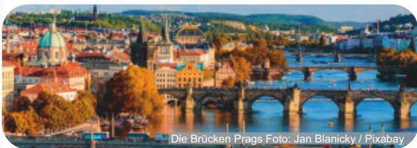
Die Brücken Prags

Der heutige Tag steht ganz im Zeichen der Prager Burg und der Kleinseite. Mit unserer Reiseleitung besichtigen wir u.a. den Hradschin. Der Berg umfasst nicht nur die gewaltige Prager Burg, sondern auch viele Bezirke, u.a. das ehemalige Armenviertel „Neue Welt“, das heute Künstlerkolonie ist. Die Kleinseite ist mit der Altstadt durch die berühmte Karlsbrücke verbunden. Hier findet man wunderschöne Gärten und stolze Paläste, die am Nachmittag jeder für sich besichtigen kann.